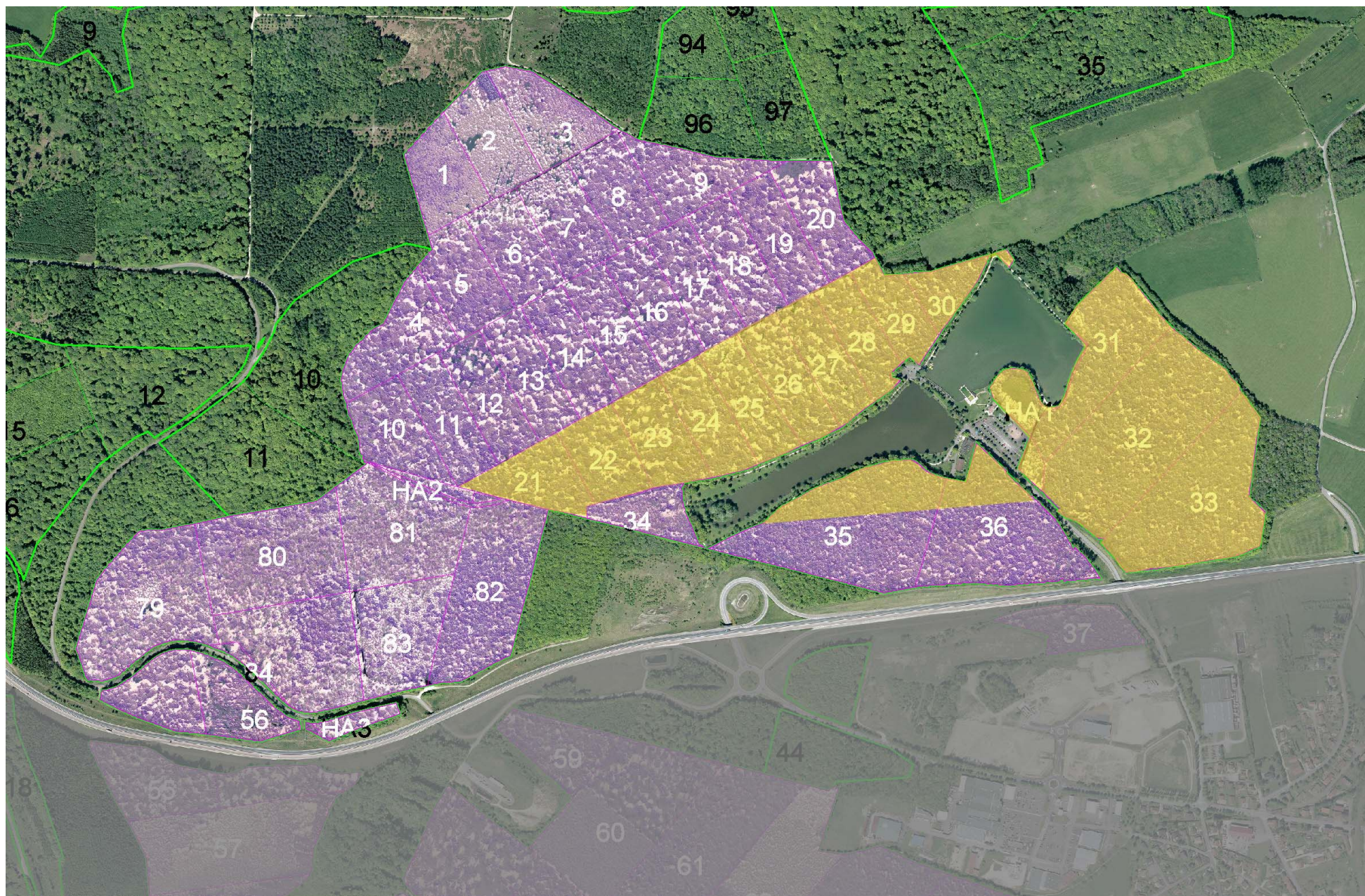
Lot 2 : les parcelles jaunes constituent la zone de sécurité